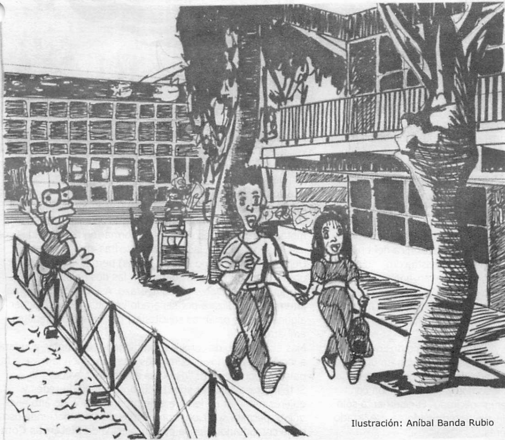
Ilustración: Aníbal Banda Rubio