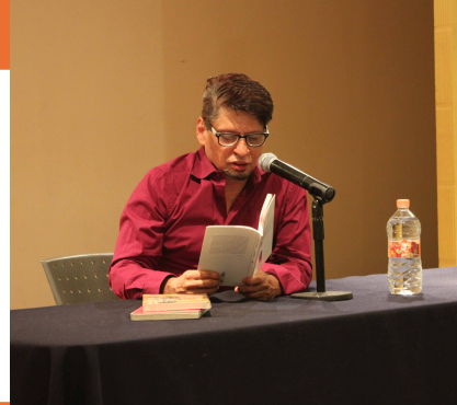
Leer para cambiar mundos, ciclo "La literatura y los jóvenes", pág. 9

Órgano Informativo del Colegio de Ciencias y Humanidades Plantel Azcapotzalco