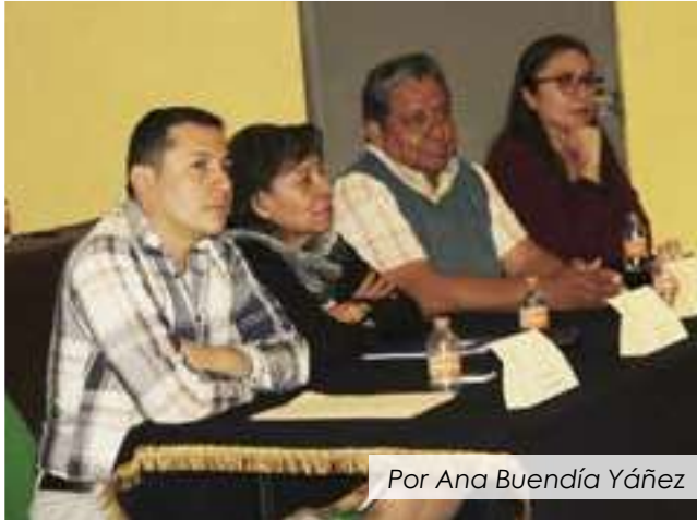
Por Ana Buendía Yáñez

El pasado jueves 24 de octubre, el Plantel Azcapotzalco fue la sede del Segundo Encuentro Metropolitano de Educación Media Superior, que dio inicio el 21 de octubre en las instalaciones de la Dirección General del Colegio con la finalidad de intercambiar conocimientos y experiencias relacionados con problemáticas de la Educación Media Superior para visualizar propuestas de solución, así como reflexionar sobre el trabajo realizado en diferentes ámbitos de la Educación Media Superior, a partir de proyectos, diagnósticos, hallazgos de investigación, experiencias y material didáctico.