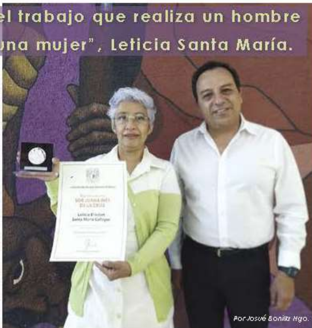
Por Josué Bonilla Hgo.

Para abrir el conversatorio, el Dr. Javier Consuelo resaltó la importancia de reflexionar acerca del papel que ha desempeñado