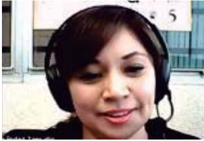
Por Ana Buendía

Realizan Feria de la Salud virtual 2022.